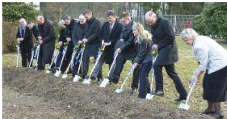
Gemeinsamer Spatenstich in Hutschdorf

(red./Hutschdorf) – Bereits am 03.03.2011 erfolgte der feierliche Spatenstich für die Erweiterung der Hutschdorfer Fachklinik Haus Immanuel für suchtkranke Frauen. Vor zahlreichen Ehrengästen dankte die bayerische Staatssekretärin für Umwelt und Gesundheit, Melanie Huml , dem gesamten Hutschdorfer Team sowie dem DGD als Träger, der für den Ausbau mit rund 7,5 Mio. Euro in Vorleistung tritt. Die Zahl der Betten wird sich durch den Neu- und Erweiterungsbau von 36 auf 60 erhöhen. Zusätzliche Schwerpunkte werden die Aufnahme von Frauen mit Kindern sowie die Behandlung von traumatisierten Frauen.